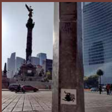
Paseo de la Reforma, CD MEX