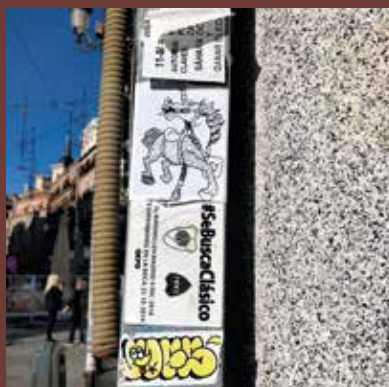
Plaza del Sol Madrid, España

En un intento por recuperar la libertad, el equipo Fantasma salió a apañarse del espacio público. Lugar que comúnmente es ocupado por las empresas con sus anuncios, los partidos políticos, las ONGS, los gruperos, los usureros y demás actores de la sociedad con sus campañas para vendemos algo o posicionar sus productos e ideas.